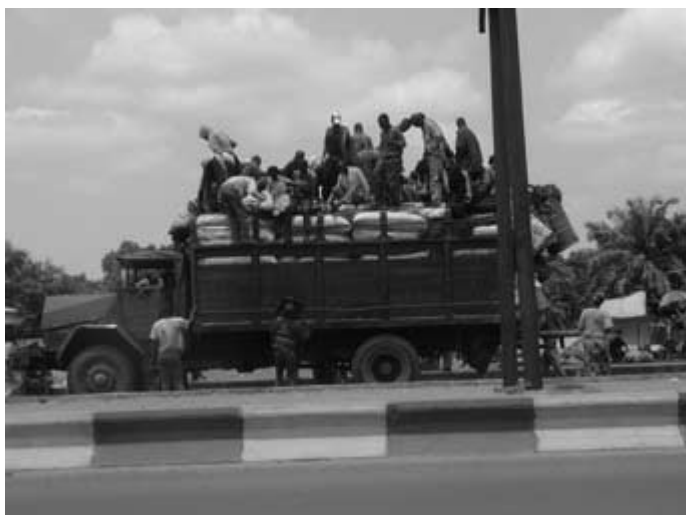
Kinshasai távolsági autóbusz

Nagy nehézséget jelentett a közlekedés. Nincs tömegközlekedés a városban, az emberek ún. iránytaxival közlekednek. Ez az itthon ismert stoppolásnak megfelelő eljá-