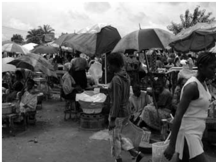
Szabadtéri piac Kinshasában

járjunk, mint Izrael fiai, akiknek a negyvennapos vándorlás helyett negyven évet kellett eltölteniük a pusztában. Az első hetek után megszoktuk egymást, a körülményeinket, az afrikai mentalitást, addigra már sikerült meglátni a jót, a szépet is, és sikerült feladatokat találni, hasznossá tenni magunkat.