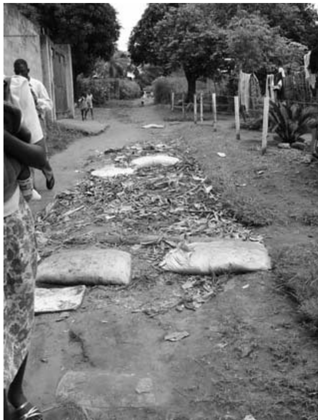
Kongói „lakótelepi” utca