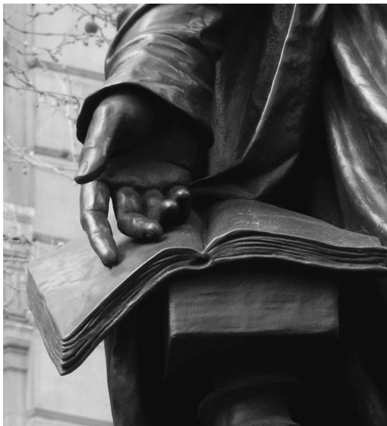
William Tyndale bronzszobra Londonban, részlet (Sir Joseph Boehm alkotása, 1884)