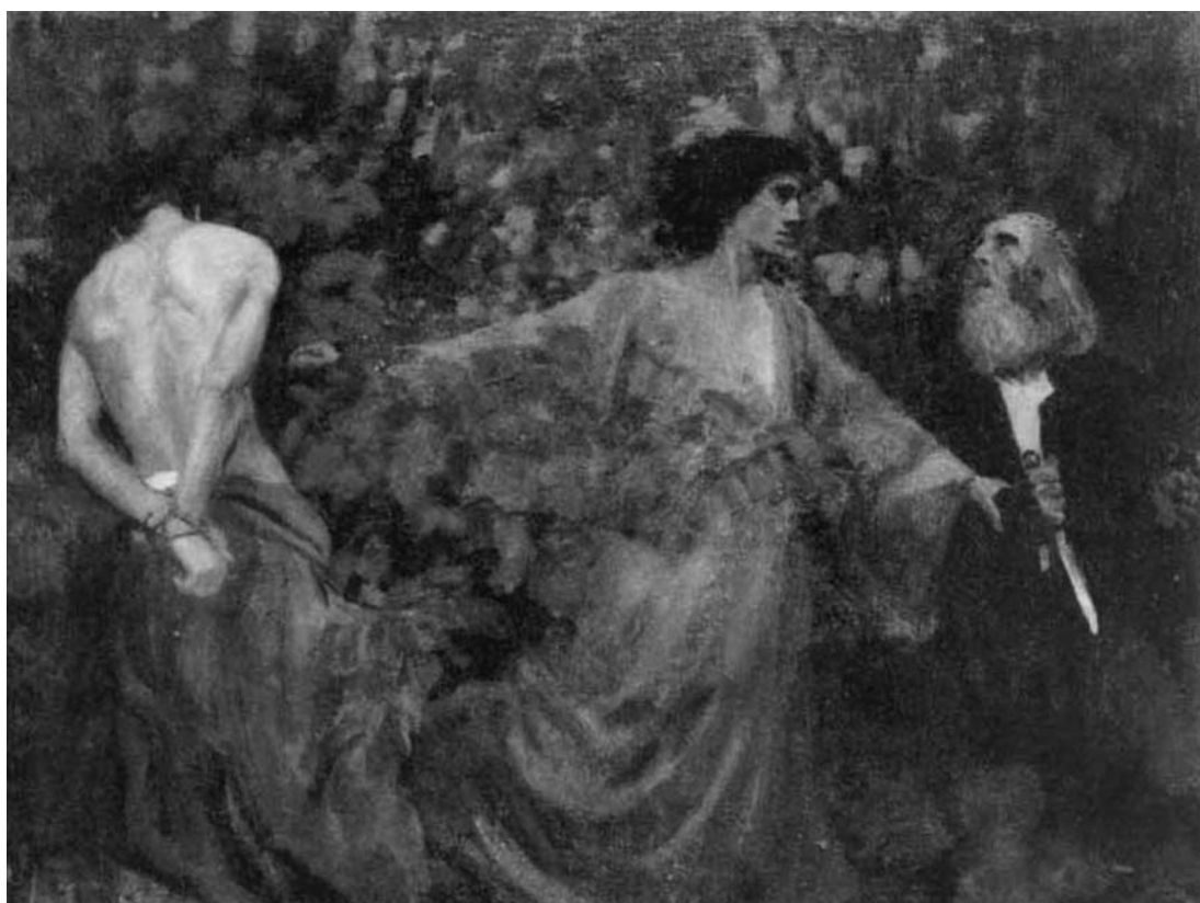
Ferenczy Károly: Ábrahám áldozata, 1901 (Magyar Nemzeti Galéria)